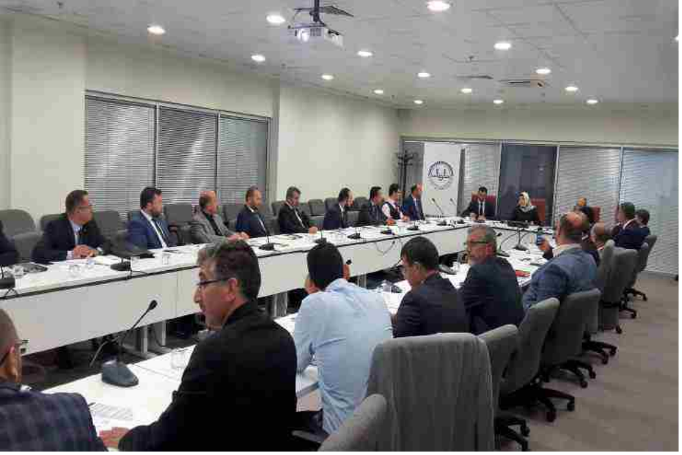
Çalıştay Salonu ve Oturumlar